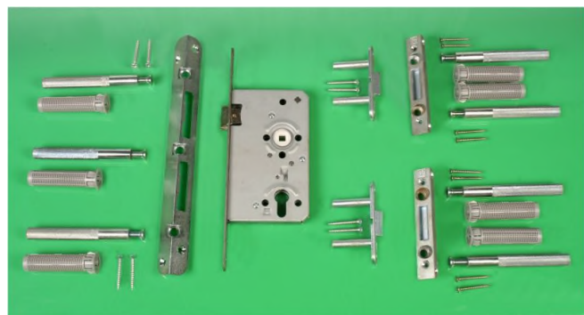
Beispiel eines (Tür-)Nachrüstsets

Auch (Holz-)Türen können mit einem Sicherungssystem im Falz nachgerüstet werden. Zusätzlich ist ein einbruchhemmender Schutzbeschlag und Profilzylinder erforderlich.